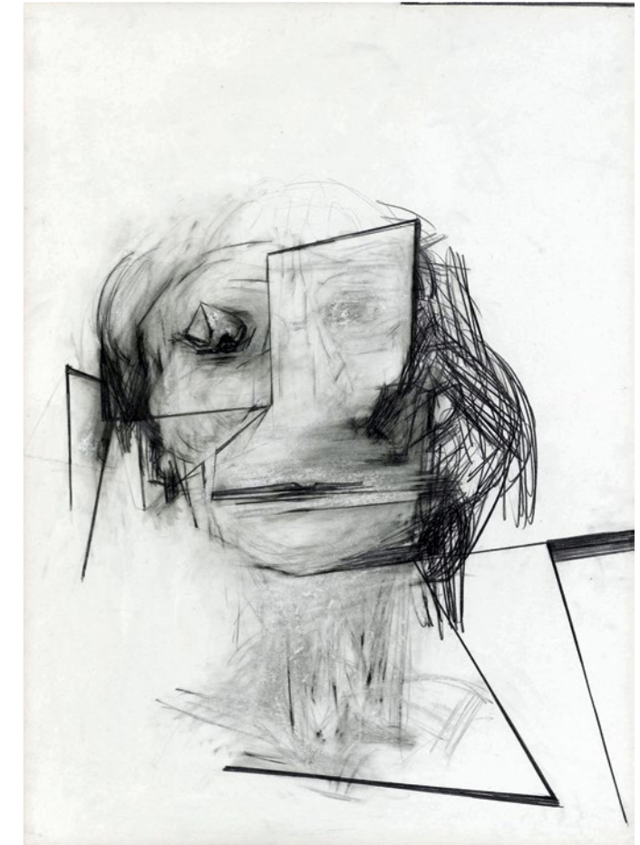
Porträt A. K., 2017. Graphit auf Papier, 100 x 75 cm