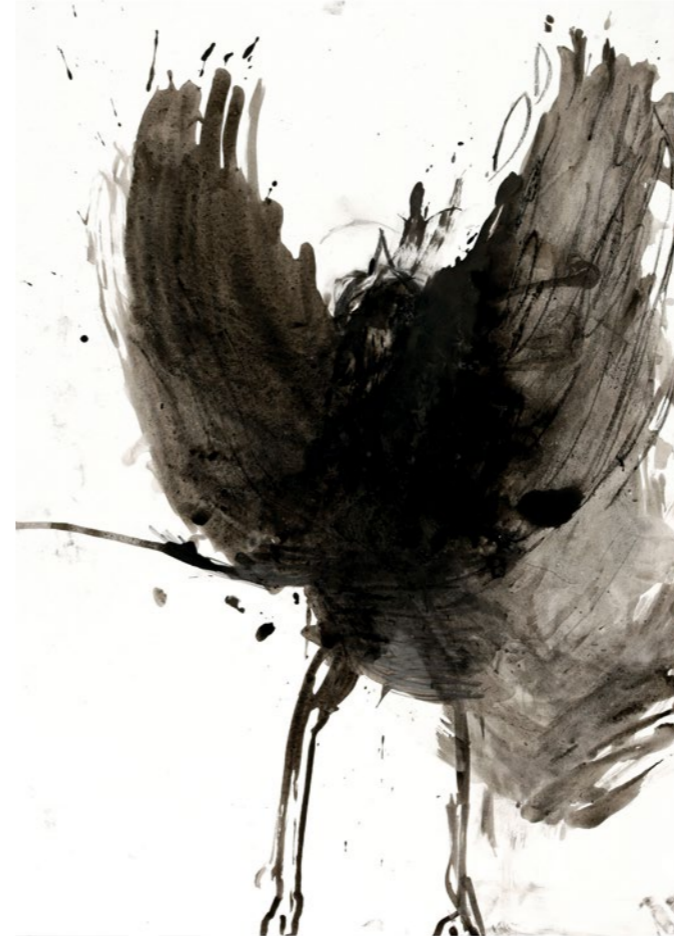
Tanzvogel, 2021. Tusche auf Papier, 86 x 61 cm