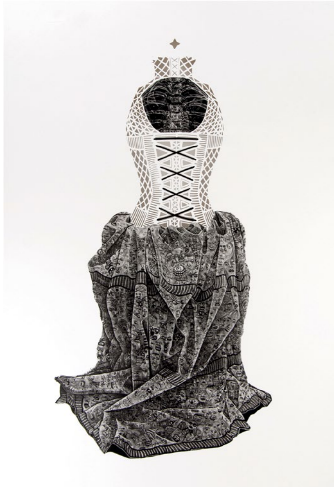
OPHELIA IV/2, 2017. Mezzotinto, Papierschnitt, ca. 135 x 93 cm