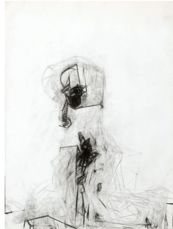
Absprung, 2013. Graphit auf Papier, 100 x 75 cm